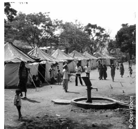
« Les extrémistes hindous chassent 50'000 chrétiens. Regard dans un camp de réfugiés du district du Kandhamal (Orissa). »

Beaucoup de gens ne voient plus la foi chrétienne comme quelque chose d'étranger. La question est: Qu'est-ce qui nous changera? Quelles valeurs? Nous espérons que ce sont les valeurs de l'Evangile.