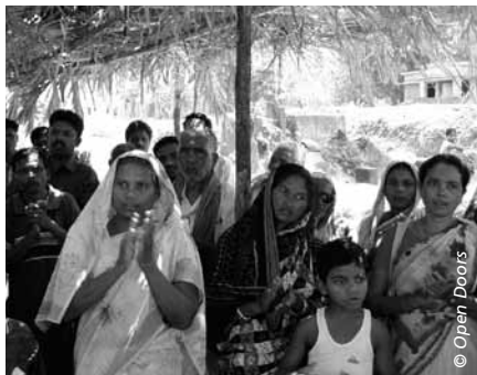
Culte dans un camp de réfugiés du district du Kandhamal (Orissa)

Howell : La persécution a conduit à renforcer le mouvement de prière. Par ailleurs, les chrétiens ont pardonné publiquement ceux qui les ont persécutés, torturés, et qui ont tué leurs proches. Les communautés chrétiennes s'engagent pour la réconciliation. Elles ont mené des marches pour la paix et des entretiens avec des représentants des autres religions. Elles n'ont jamais exercé de représailles. Dans la société civile, spécialement parmi les intellectuels, on prend au sérieux le fait que les chrétiens pratiquent ce qu'ils prêchent